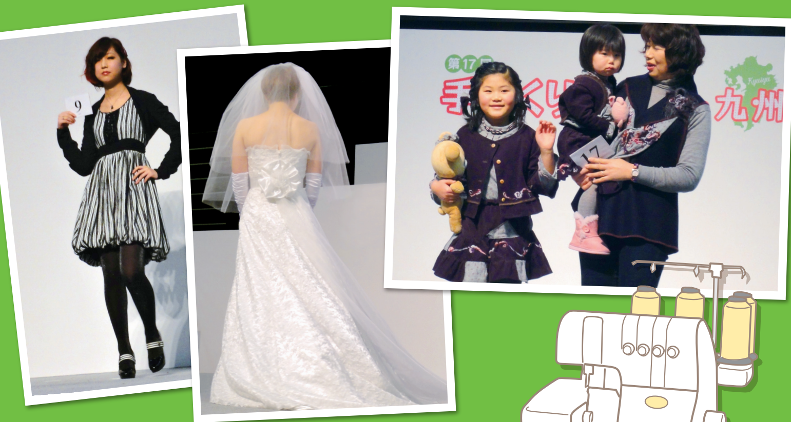
※写真は第2回開催時の様子(左2枚が準グランプリ、右がグランプリ作品)